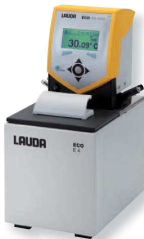
Termostato de calefacción E 4 S

Los termostatos de calefacción con cabezal de control Silver son adecuados para un rango de temperatura de hasta 150 °C. En todos los termostatos de calefacción se incluye de serie un serpentín de refrigeración. El E 4 S está equipado además con una tapa del baño y conexiones de bomba con conectores de plástico para la conexión de una aplicación externa.